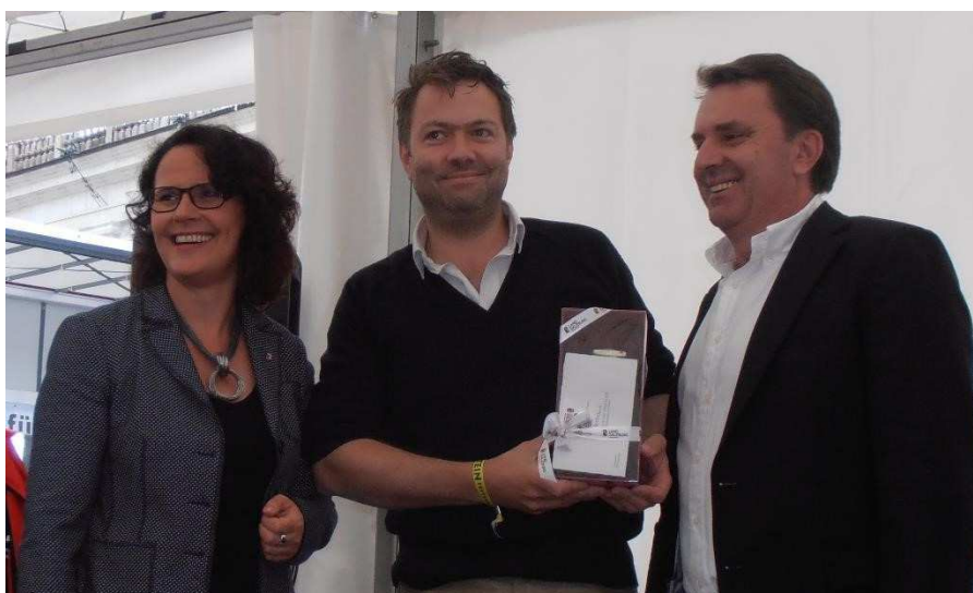
Tous les lauréats du FEdIP 2016 Salzburg.