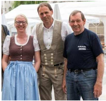
(le staff de Salzburg...😊)